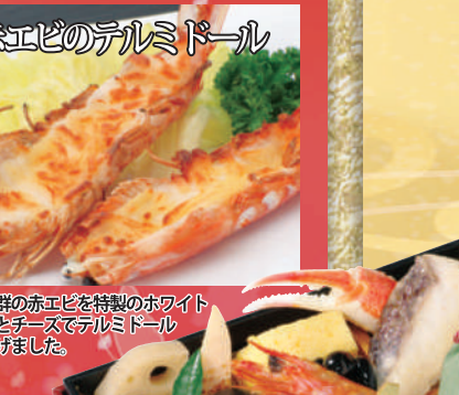
鮮度抜群の赤エビを特製のホワイトソースとチーズでテルミドールに仕上げました。