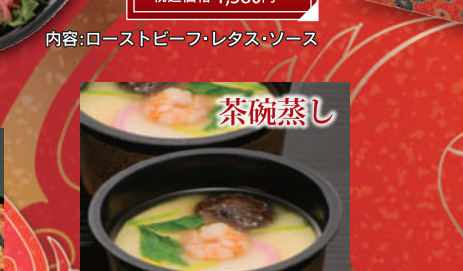
⑮ 茶碗蒸し 1個 本体価格 278円 税込価格 300円 内容:玉子・えび・しいたけ・蒲鉾・鶏肉・きんなん・三つ葉