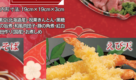
⑭ えび天 1尾 本体価格 204円 税込価格 220円 内容:えび 長崎エリアは販売なし