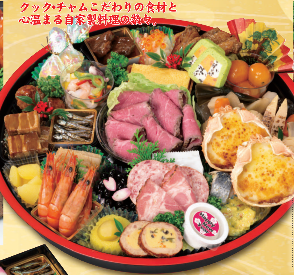
クック・チャムこだわりの食材と心温まる自家製料理の数々。