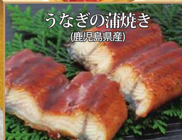
自然豊かな大隅半島で育てたうなぎです。一度蒸してから焼き上げ、ふっくらと柔らかく仕上げられています。

①おせち2段重ね 3~4人前 本体価格 17,130円 税込価格 18,500円 内形寸法:23.2cm×23.2cm×4.5cm×2段