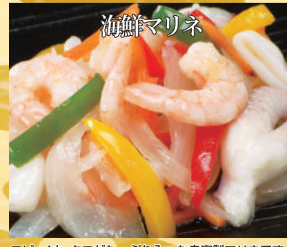
エビ、イカ、タコがたっぷり入った自家製マリネです。