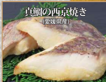
鮮度抜群の真鯛をこだわりの西京味噌でじっくりと漬け込み香ばしく焼き上げました。