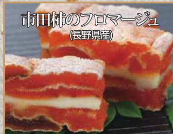
濃厚な干し柿の甘味とさわやかなクリームチーズが相性抜群です。ひとつひとつ手作りしています。