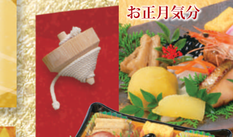
⑧ お正月気分 1人前 本体価格 2,204円 税込価格 2,380円 内形寸法:19cm×19cm×3cm