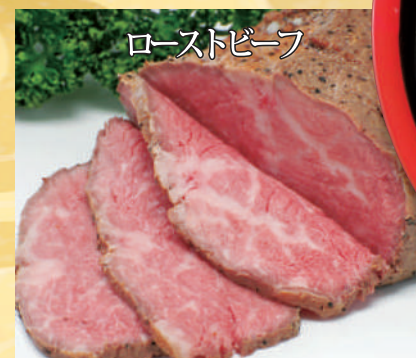
牛モモ肉を、独特の製法でやわらかく仕上げました。毎年人気一品です。