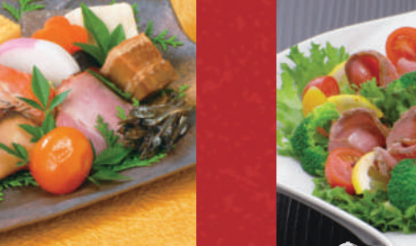
⑨ ローストビーフ 3人前 本体価格 1,463円 税込価格 1,580円 内容:ローストビーフ・レタス・ソース