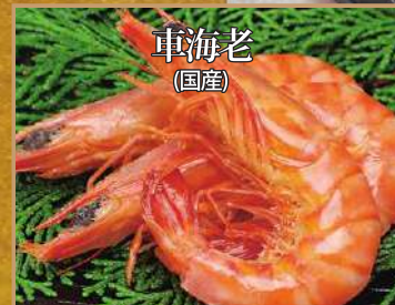
活きの良い車海老を活き締めしてオリジナルの味付けて煮付けました。