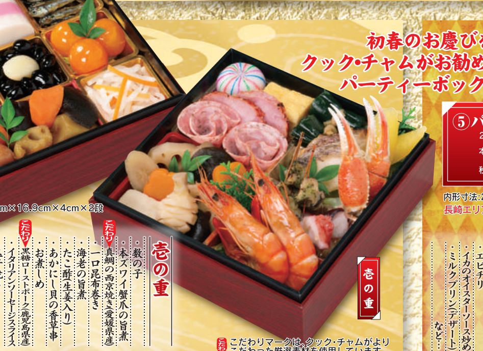
初春のお慶びを食卓に。クック・チャムがお勧めするミニおせち・パーティーボックスをどうぞ。