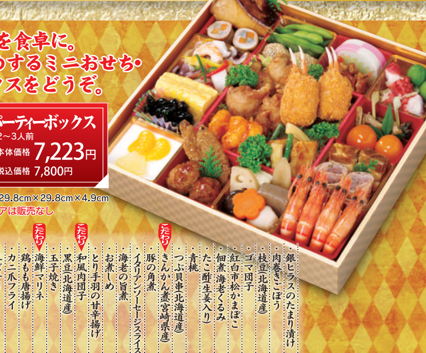
初春のお慶びを食卓に。クック・チャムがお勧めするミニおせち・パーティーボックスをどうぞ。