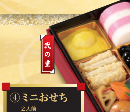
④ ミニおせち 2人前 本体価格 9,149円 税込価格 9,880円 内形寸法:16.9cm×16.9cm×4cm×2段