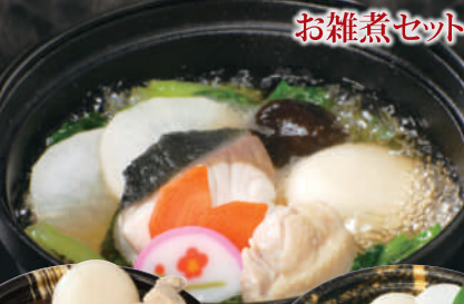
⑫ お雑煮セット(餅2個) 1人前 本体価格 630円 税込価格 680円 内容:餅(2個)・かつお菜・大根・梅蒲鉾・金時人参・しいたけ・あごだしスープ 長崎エリアは販売なし