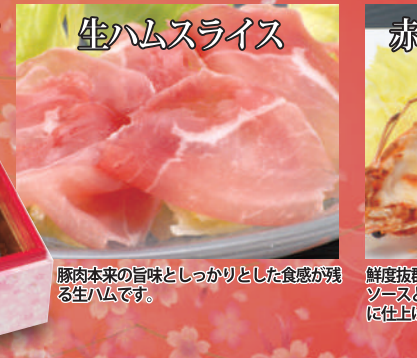
豚肉本来の旨味としっかりとした食感が残る生ハムです。