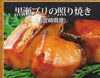
宮崎県産の「黒瀬ブリ」を、贅沢にも鮮度抜群の状態に照り焼きにしています。ふっくらした食感と深い味わいがあります。