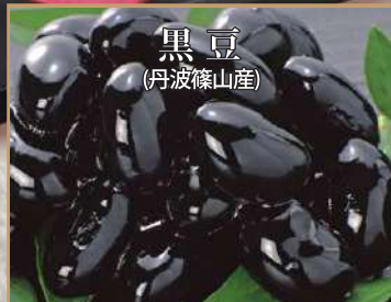
丹波篠山産の大粒な黒豆を甘さ控えめにふっくら炊きあげました。