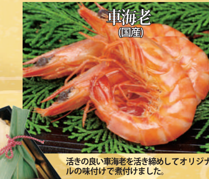
活きの良い車海老を活き締めしてオリジナルの味付けで煮付けました。