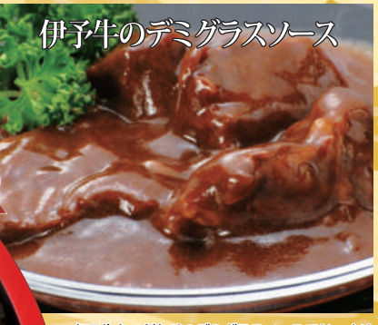
伊予牛をこだわりのデミグラスソースでじっくりと煮込み柔らかく仕上げました。