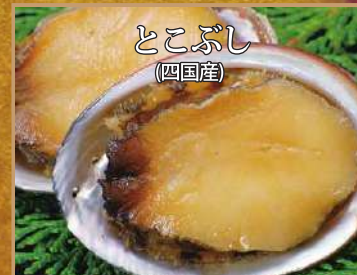
味が濃厚で歯ごたえがある天然とこぶしです。オリジナルの上品な味付けてふっくら仕上げています。