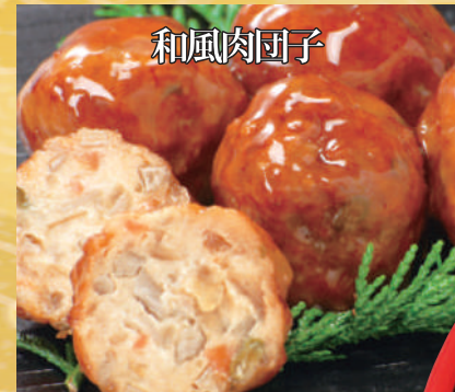
野菜たっぷりの家庭的な肉団子です。シャキシャキとした食感が特徴です。