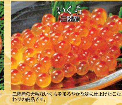
三陸産の大粒ないくらをまろやかな味に仕上げたこだわりの商品です。