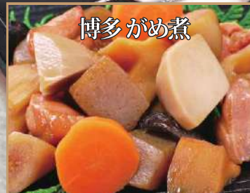
博多のお節に欠かせないがめ煮を、贅沢にもすべて国産の食材で仕上げました。